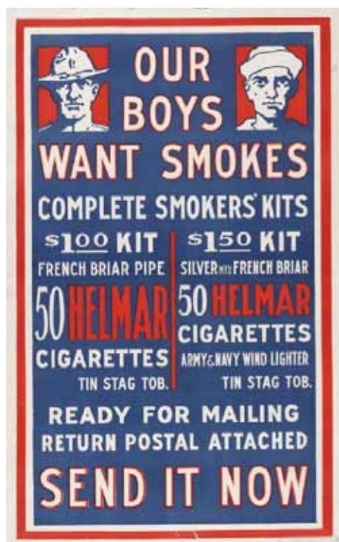
Gráfico 2: Aviso de Tabaco en Épocas de Guerra