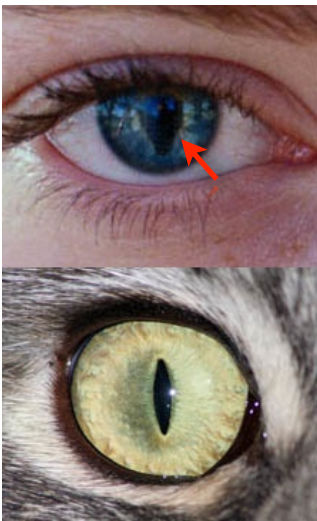
Coloboma ou síndrome do olho de gato

A descrição anterior não permite que a imensa maioria dos leitores - incluindo os médicos - faça qualquer especulação acerca das alterações clínicas que os pacientes acometidos por essa síndrome apresentam. No entanto, basta uma consulta a um dicionário de termos médicos para se descobrir, por exemplo, que o termo "coloboma" se refere a uma malformação do olho, que se dá durante o segundo mês de gestação, podendo atingir uma ou mais estruturas do globo ocular e levando a formação de um buraco, divisão ou rachadura aparente (figura). Desse modo, quando um oftalmologista comunica ao colega que identificou um "coloboma", o último, além de compreendê-lo prontamente, parte do princípio que o primeiro realizou as investigações cientificamente preconizadas como necessárias para se chegar a essa conclusão.